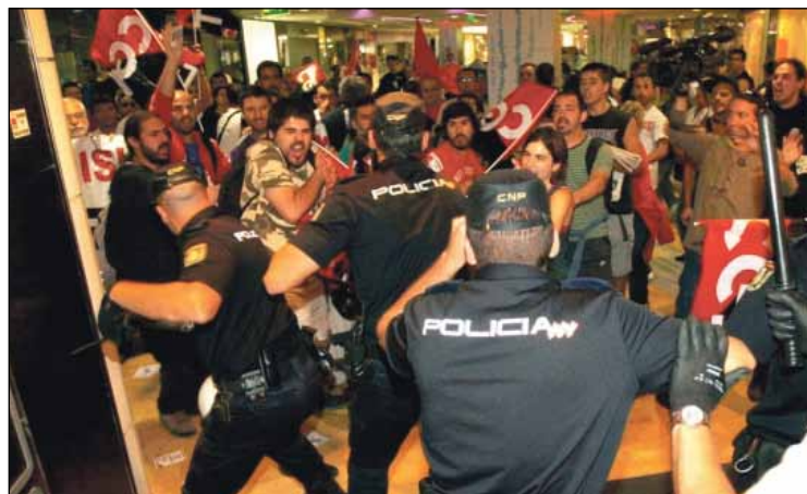
Carga policial contra un piquete informativo en un centro comercial de Málaga

La policía, que evidentemente no había estado presente la víspera para asegurar que los trabajadores no eran coaccionados por la empresa para de-