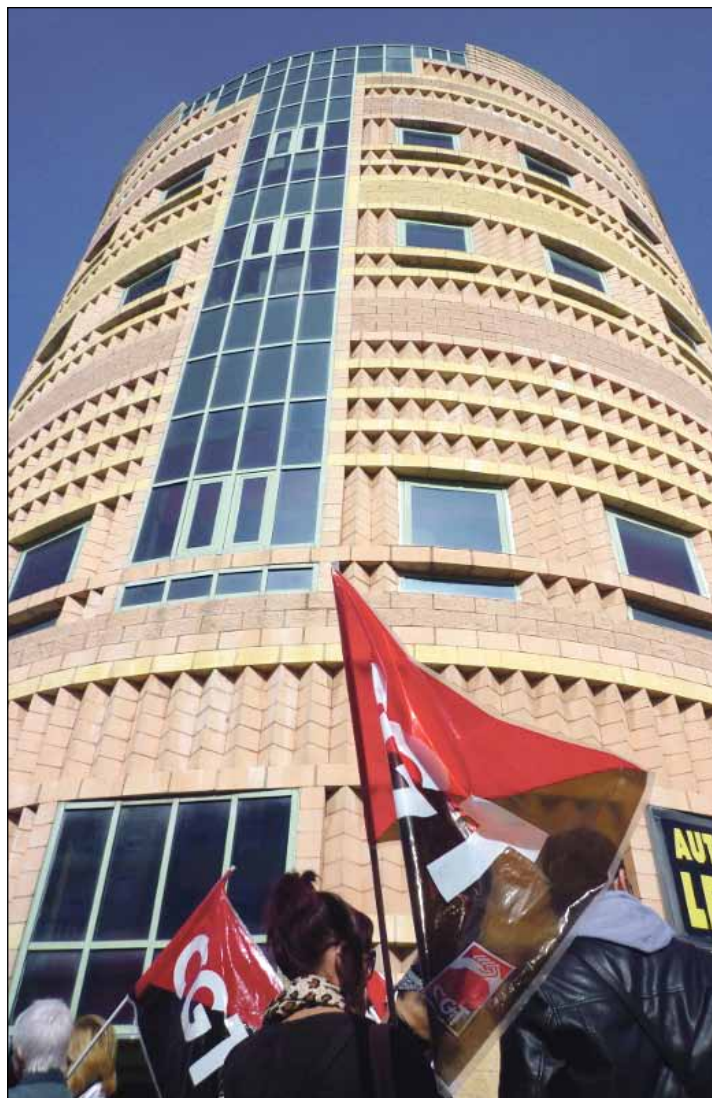
Concentración en Sevilla de delegados de CGT ante la sede de Teleperformance

En Sevilla, los trabajadores y trabajadoras de CGT se concentraron ante la sede de la empresa Teleperformance, junto al centro comercial Los Arcos.