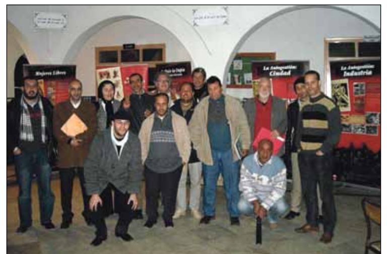
Participantes en las jornadas sobre la revolución libertaria celebradas en Alcazarquivir

bertaria en Marruecos y en España —los mismos militares partidarios de la guerra “contra el moro” fueron los que dieron el golpe de estado en España en el 36— se hizo un recorrido explicativo por los distintos paneles que componen la Exposición que siguieron los asistentes con mucha atención. Tras las intervenciones de la mesa redonda se abrió un interesante debate sobre las diferentes posiciones en torno a la revolución en