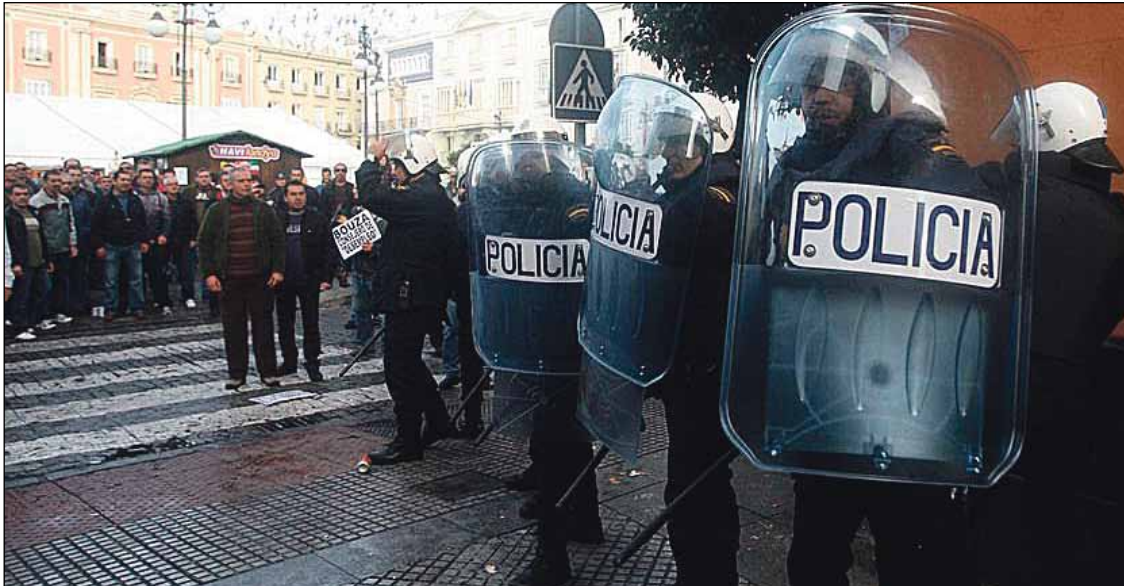
La policía, momentos antes de cargar contra los trabajadores de Delphi

CÁDIZ ▶ Vergonzosa actuación de la Junta de Andalucía, que no exige a la empresa el cumplimiento de sus compromisos y ataca a los trabajadores por exigir lo firmado y avalado por el Gobierno