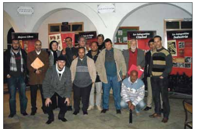
Participantes en las jornadas sobre la revolución libertaria celebradas en Alcazarquivir

bertaria en Marruecos y en España —los mismos militares partidarios de la guerra “contra el moro” fueron los que dieron el golpe de estado en España en el 36— se hizo un recorrido explicativo por los distintos paneles que componen la Exposición que siguieron los asistentes con mucha atención. Tras las intervenciones de la mesa redonda se abrió un interesante debate sobre las diferentes posiciones en torno a la revolución en