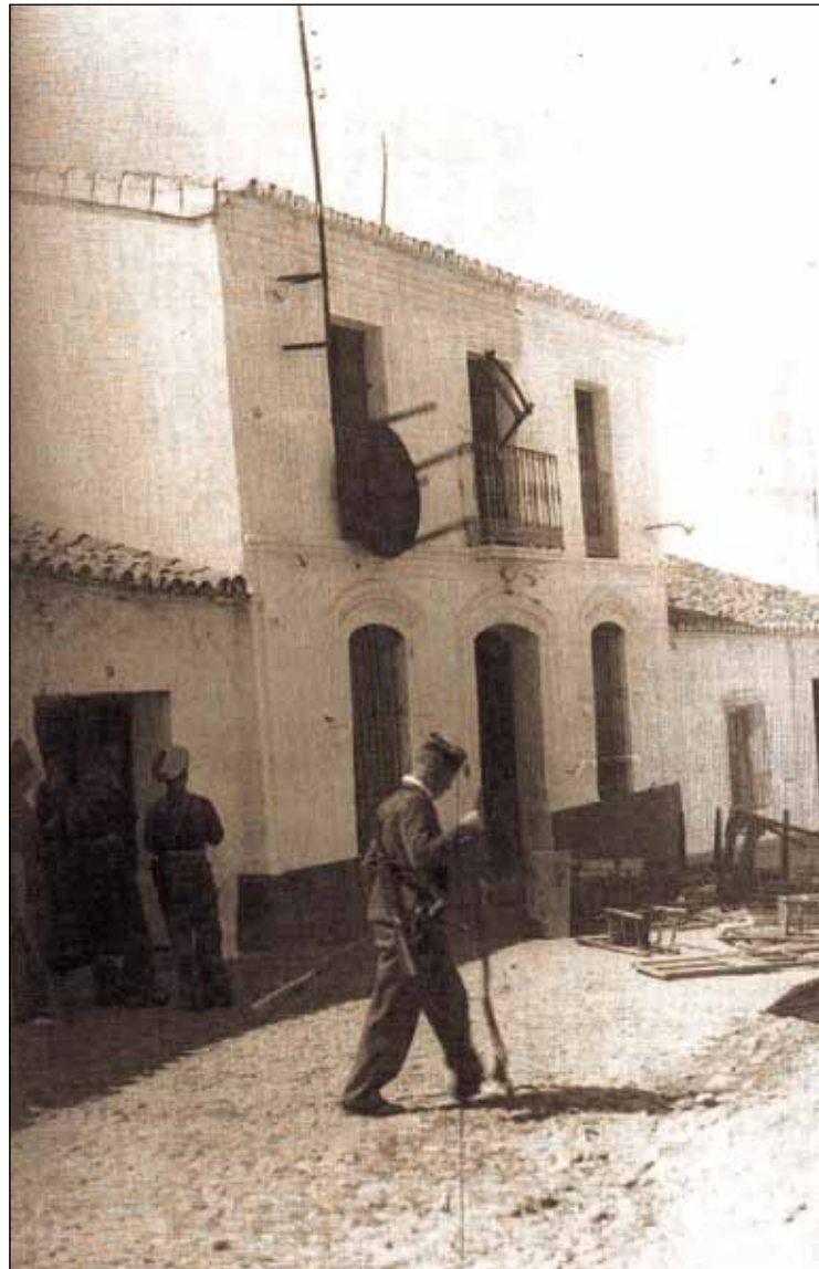
Fuerzas franquistas requisando propiedades de ciudadanos republicanos

El Grupo de Trabajo “Recuperando la Memoria de la Historia Social de Andalucía” (CGT-A) lanza esta iniciativa —el Proyecto Rapiña— para generar un proceso de colaboración y socialización de experiencias, conscientes de que es una cuestión que no puede quedar al albur de la