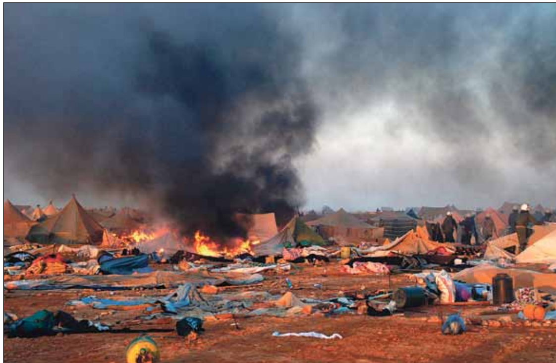
El campamento saharauí arrasado por el ejército marroquí

CGT-A exige la creación de una Comisión Internacional de Investigación y llama a la unidad de acción de todos los oprimidos por la monarquía alauita