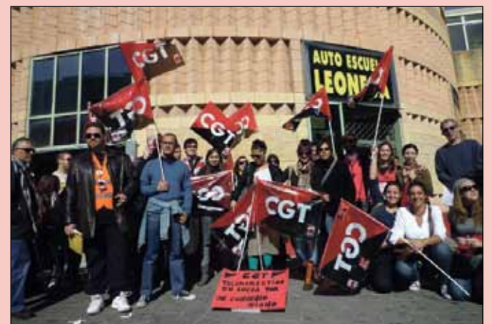
La concentración se llevó a cabo en el centro comercial Los Arcos

◆ SEVILLA. COORDINADORA DE TELEMARKETING. BdP.