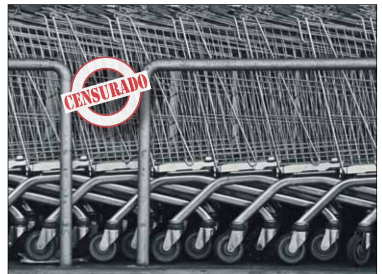
Los carros vacíos pueden herir la sensibilidad de los mercados

vado grado de consenso” (se refiere a la firma de un acuerdo de aplicación con CC.OO. y UGT). Más de lo mismo. Como continúa la protesta y Griñán no se atreve a salir de su despacho, meten en la nevera este segundo Decreto y lo tramitan como Proyecto de Ley. Por supuesto, CGT está en contra también del Decreto-ley 6/2010 o de la Ley 1/2011 que el Parlamento (con mayoría absoluta del